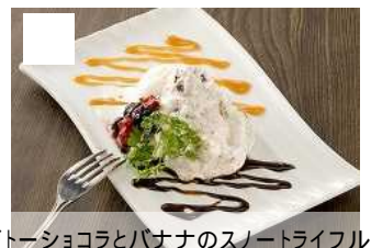
ガトーショコラとバナナのショートライフル