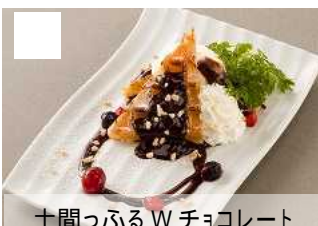
土間っふる W チョコレート