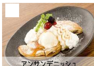
アンサンデニッシュ