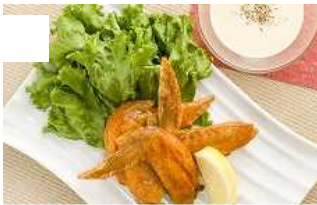
バッファローチキンウィング