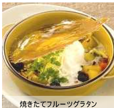
焼きたてフルーツグラタン

「土間カフェ冬」のテーマは「カラダケア」。最近、「カラダにいい」と女性に注目されているフルーツや豆類、野菜を使ったメニューを中心に、フード 6 品、デザート 6 品、ドリンクは、「土間カフェ秋」より 1.5 倍に増えた 18 品[ライトカクテル(アルコール度数 5%以下)9 品、ノンアルコールドリンク 9 品]を新たにご用意いたしました。