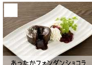
あったかフォンダンショコラ