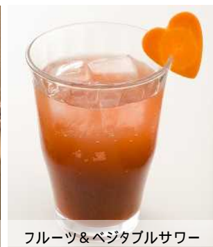
フルーツ&amp;ベジタブルソーダ