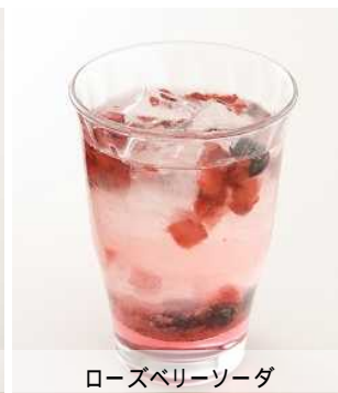
ローズベリーソーダ

「土間カフェ」メニューは、定番メニューとは異なり、女性に的を絞った商品開発を行っています。お酒が好きな女性はもちろん、苦手な女性も気楽に「居酒屋」を楽しめる、それが「土間カフェ」のコンセプトです。女性同士に最適なおしゃれなフードやドリンクが充実した「土間カフェ」をこの機会にみなさまでぜひご体験ください。