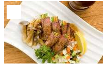
やわらかビーフのサラダロール