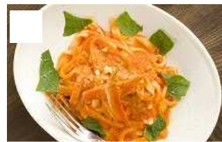
カニクリームのもちもちきしめんパスタ